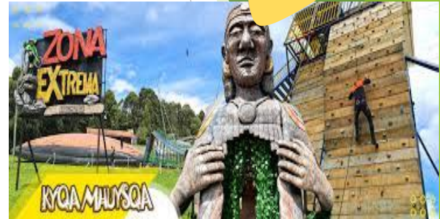
Facativá – Contiguo al Parque Arqueológico Piedras de Tunjo.

Se debe indicar la fecha de visita del parque, las boletas se reclaman directamente en el parque, con orden emitida por nuestro proveedor (BIENESTAR CORP).